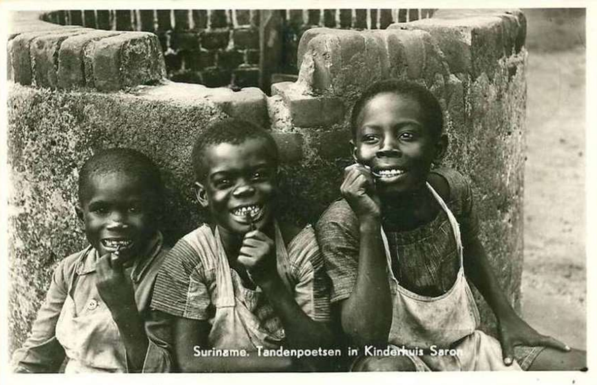
Suriname. Tandenpoetsen in Kinderhuis Saron