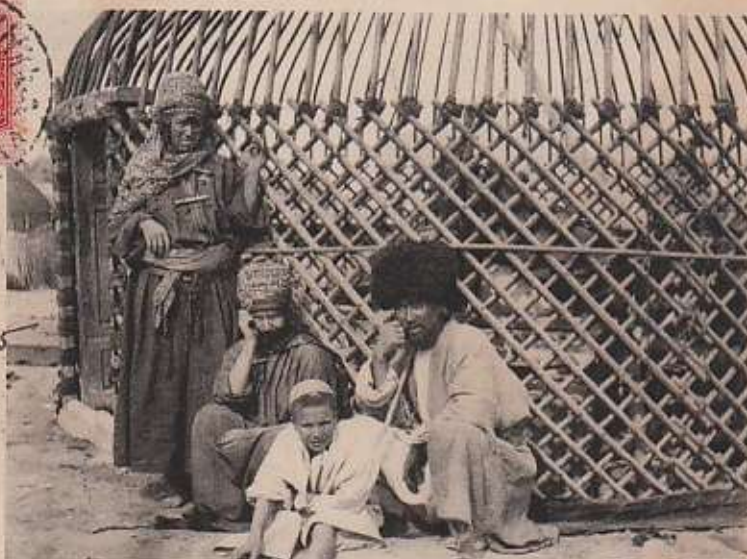
Tecunusi.—Tektlatl. N. 74.