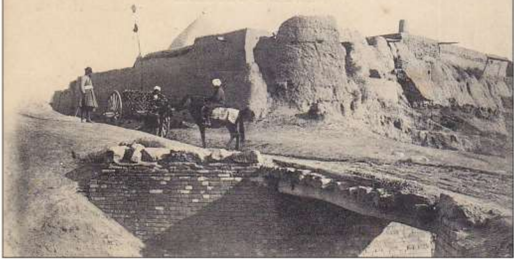
Bab Arab meeset is sietramball eröd